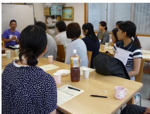
図1 当事者の体験談